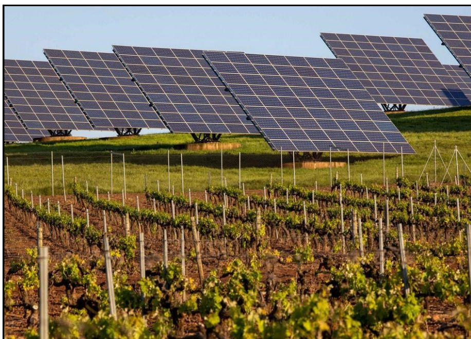
Foto.– Instalación de una Planta Solar junto a tierras cultivadas.

Por esta razón, esta asociación voluntaria de personas de la comarca de la Serranía, nacida ahora hace más de 30 años, insiste en la necesidad de hacer un frente común para salvaguardar nuestro patrimonio y nuestras zonas rurales más preciadas.